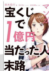
『マンガ宝くじで1億円当たった人の末路』 鈴木 信行／著 星井 博文／シナリオ 松枝 尚嗣 ほか／作画 日経BP社 日経BPマーケティング(発売) 2018年

お金の管理のしかたや使い方、ローンや保険、金融など、10代で身につけておきたいお金の知識やしくみがわかりやすく解説されている。いざというとき困らないために読んでおきたい一冊。