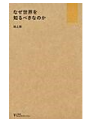
『なぜ世界を知るべきなのか』 池上 彰／著 小学館 2021年

この本は中学校で行われた講演をもとに加筆された。著者の世界各地での取材体験からの言葉は説得力があり、子供から大人まで広く共感できる。 コロナ禍でリアルな世界に飛び出すことをためらう人へ、内向きにならずぜひ世界に目を向けてほしいと訴える。