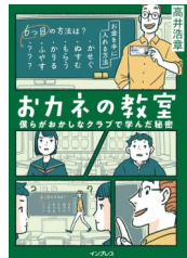
『おカネの教室』 高井 浩章／著 インプレス 2018年

「お金を手に入れる方法を6つ挙げよ」稼ぐ、盗む、貰う、借りる、増やす…。あとひとつは何だろう？ 経済やお金の話を魅力的な登場人物とストーリーで楽しく学べる一冊。