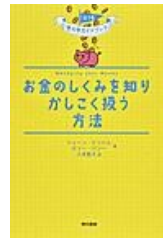
『お金のしくみを知りかしく扱う方法』 ジェーン・ビンハム／著 ホリー・バシー／著 小寺 敦子／訳 東京書籍 2020年

「ドラえもんひみつ道具が実際にあったら？」というのは誰もが一度は考えた事があるだろう。この本は、もしひみつ道具が実現したら社会がどう変わっていくのか、特に経済の動きに注目して書かれている。実在する企業名も多く登場しているので、現実味をもって読める一冊。