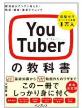
『YouTuberの教科書』 大須賀 淳／監修 インプレス 2021年

目指せ！チャンネル登録1万人。 今さら聞けない基礎知識から、再生数が伸びる動画作りのワザまで、この一冊ですっきり身につきます。 将来なりたい職業上位にあるYouTuber。企画・撮影・編集・運営まで、楽しく続けるためのノウハウが詰まった一冊。