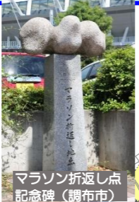
マラソン折返し点 記念碑 (調布市)