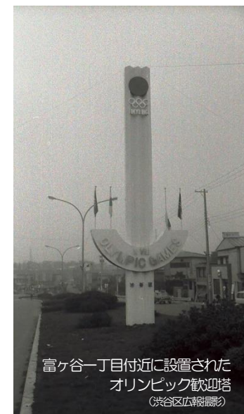
富ヶ谷一丁目付近に設置された オリンピック歓迎塔

オリンピックの開催は渋谷区のインフラ整備を大きく推進し、五輪橋は代々木競技場・選手村のある代々木エリアと国立陸上競技場・東京体育館のある明治公園エリアを結ぶ道路の整備に伴いJR線を跨ぐ神宮橋の南側に架けられました。橋の欄干にはオリンピックを記念する競技のレリーフが施されています。