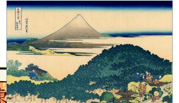
葛飾北斎画 富嶽三十六景『青山円座松』