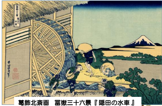
葛飾北斎画 富嶽三十六景『隠田の水車』