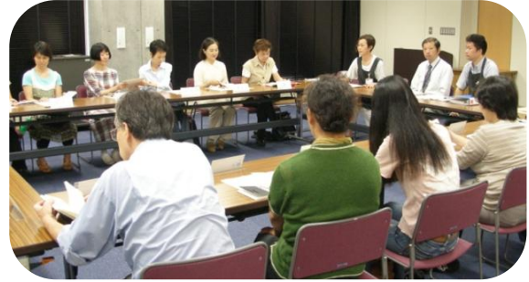
読書推進ボランティアのみなさん。(9/16説明会にて)