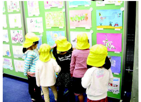
昨年度の作品展の様子