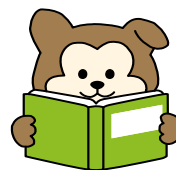
渋谷区立図書館 マスコットキャラクター ハチ